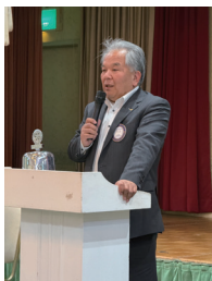
50周年実行委員長より 当日全員参加のお願い