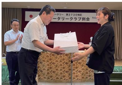
バッジと 入会セット授与