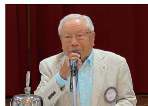
ミニ卓話 精松会員