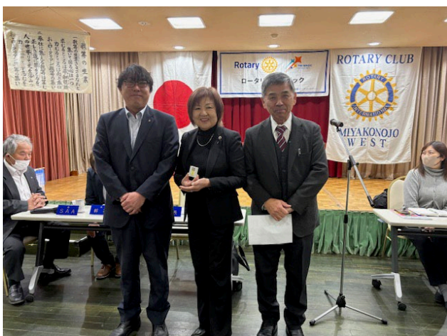
皆勤賞表彰（18年。上田会員）