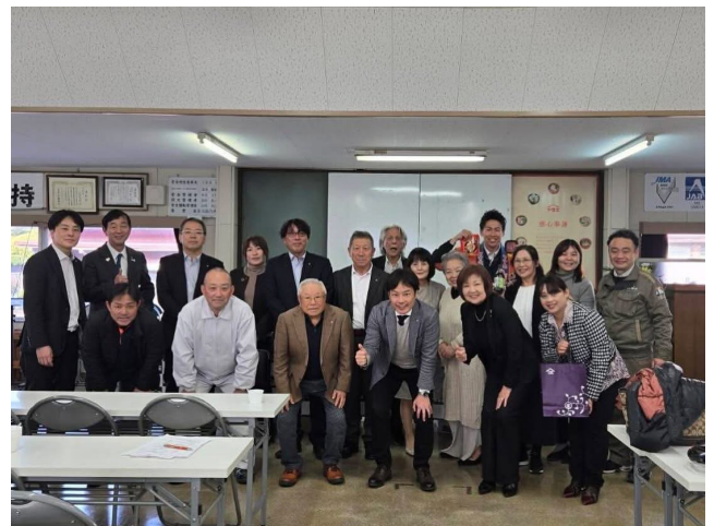
江夏社長を交え記念撮影