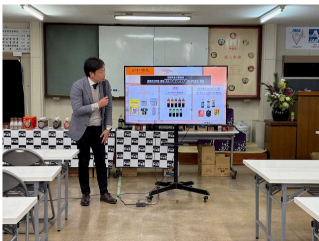
江夏社長による会社案内