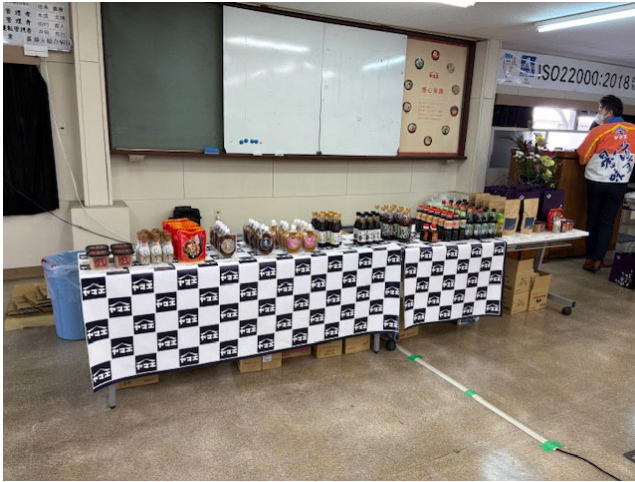
製造される食品の数々