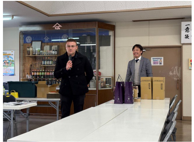
輸出担当職員（ドイツ人）の話