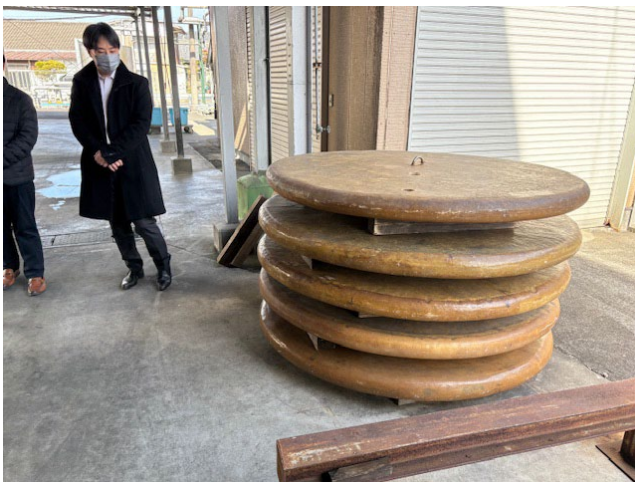
みそ工場の重し ひとつ 500kg